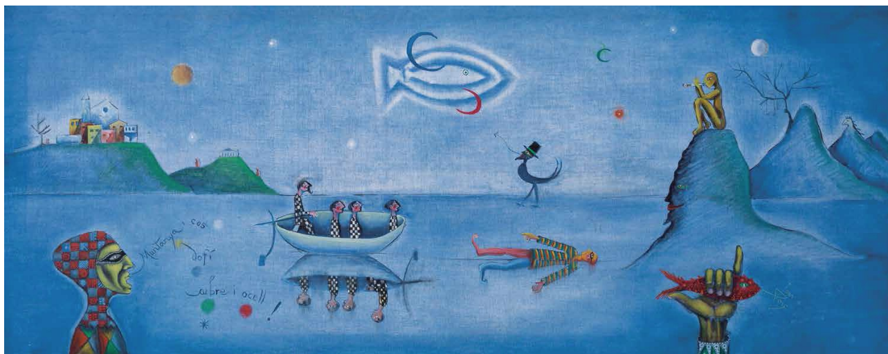
Joan Ponç, Nocturn , 1950, © Gasull fotografia, © Adagp, Paris, 2018

Exposició en col·laboració amb la Fundació Catalunya La Pedrera